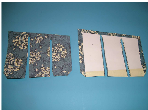
Détail du travail des cartes « à pont »

Commencer par habiller les petites séparations des 2 côtés puis les transversales à l'aide des « cartes à pont », puis le tour intérieur et enfin les cartes bulle du fond.